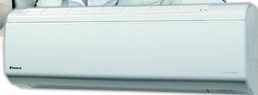
FTXR-E típusú beltéri